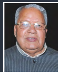
Pt. Kalraj Mishra