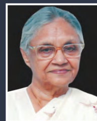
Smt. Sheila Dikshit