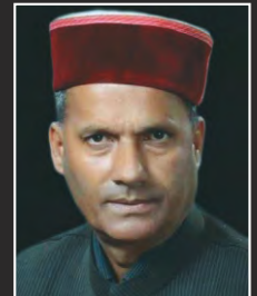
रामस्वरूप शर्मा सांसद, मण्डी हिमाचल प्रदेश

लम्बे समय से हमारे देश के युवाओं के मस्तिष्क में सरकारी नौकरी और उसकी सुविधाओं, प्रभाव को लेकर एक मनोविज्ञान बना रहा कि इससे सामाजिक प्रतिष्ठा बढ़ती है, मगर बदलते समय में भ्रांति दूर कर दी है। युवा वर्ग असीम शक्ति का केन्द्र होते हैं एवं उन्हें अपनी रूचि के क्षेत्र में प्रतिभा को बढ़ाना चाहिए। इसके लिए यह जरूरी है कि वे स्वरोजगार के क्षेत्र में बढ़ें। स्वरोजगार न केवल उनका आत्मविश्वास बढ़ाता है, बल्कि अन्य युवाओं के आत्मविश्वास को बढ़ाने में मददगार होता है। आज हमारे देश में युवाओं ने स्वरोजगार का रूख अपनाया है और अपनी सोच के बल पर कई लोगों को रोजगार दिया है। इतना ही नहीं राज्य एवं केन्द्र सरकार ने उद्यमिता के क्षेत्र में प्रभावी योजनाओं के माध्यम से युवाओं को प्रोत्साहित किया है। इसमें कोई संदेह नहीं कि देश के सामाजिक और आर्थिक विकास को बढ़ाने की दिशा में उद्यमियों की भूमिका महत्वपूर्ण रही है। कौशल विकास और टेक्नोलॉजी से जुड़े विषयों में महारथ हासिल करने के बाद युवा अपने ही क्षेत्र में स्वरोजगार प्राप्त कर देश को आर्थिक स्तर पर मजबूत कर सकते हैं। वस्तुतः देश के आर्थिक विकास का मूलमंत्र ही स्वरोजगार है जो उद्यमिता की ऊर्जा को बरकरार रखता है।