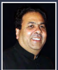
Shri Rajeev Shukla