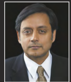
Shashi Tharoor Former Union Minister Govt. of India

India has the potential to emerge as the human resources skill capital of the world although only 4.5 per cent of its total workforce is skilled now. This was stated by Union Minister of Skill Development and Entrepreneurship Rajiv Pratap Rudy. "Though China has moved forward in manufacturing, India's strength lies in its diversity, talented human resources and English language base. The country has the potential to emerge as the world's human resource skill capital. And nobody can stop us," Rudy said. Noting that Korea's 96 per cent workforce is skilled, the minister said only 4.5 per cent of India's work force has been considered as skilled. China has 46 per cent skilled man power, USA 58 per cent, Germany 70 per cent, UK 68 per cent and Japan 80 per cent, the Union Minister said. "This figure rattles us," Rudy said, adding that even the youths having engineering and management degrees, face problem in finding jobs. As many as 16 lakh engineering seats remained vacant due to lack of demand of engineers in the country, he said. Stating that only basic degrees are not sufficient to get employment, Rudy said, "Twelve years in schools and colleges may not provide employment, but the skill training of 12 months ensures that." He said India required a huge investment in the skill development sector in order to provide employment to the youths.