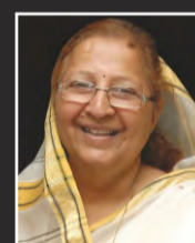
Smt. Sumitra Mahajan