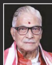
Dr. Murli Manohar Joshi