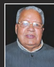
Shri Kalraj Mishra