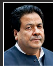
Shri Rajeev Shukla