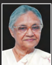
Smt. Sheila Dikshit