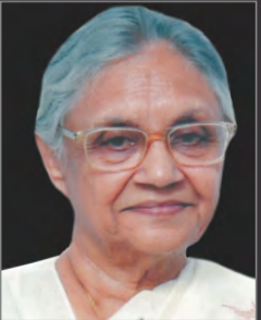
श्रीमती शीला दीक्षित