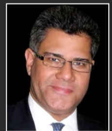
Alok Sharma Member of Parliament West Berkshire (UK)

The grandfather-of-three came to Hanwell from India in 1968 and started out as a bus conductor on the 207 route before studying at London School of Economics on a Trade Union Scholarship and eventually working as a day services manager for people with learning disabilities in Hillingdon. Alma Family wishes him all the best.