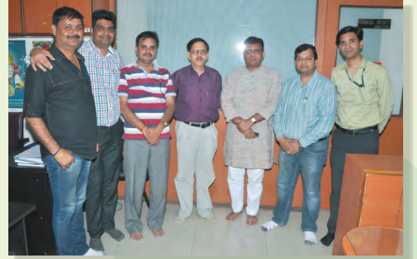
शिक्षक दिवस के अवसर पर वरिष्ठजन