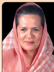
सोनिया गाँधी (अध्यक्ष, अ.भा. कांग्रेस कमेटी)

The senior BJP leader also said that the NDA government has succeeded in striking a balance between growth and inflation.