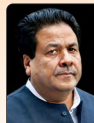
राजीव शुक्ला (पूर्व केन्द्रीय मंत्री)