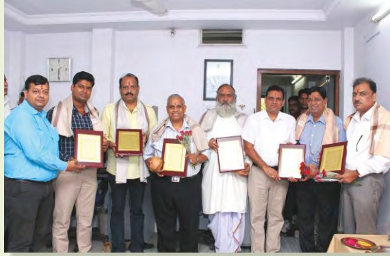
शिक्षक दिवस के अवसर पर वरिष्ठजनों का सम्मान