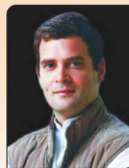
राहुल गाँधी (उपाध्यक्ष, अ.भा. कांग्रेस कमेटी)