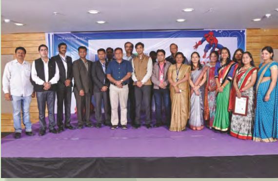
अल्मा किड्स इंटरनेशनल प्री-स्कूल के वार्षिकोत्सव कार्यक्रम में अल्मा के सदस्य एवं पदाधिकारीगण