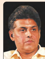
मनीष तिवारी (पूर्व केन्द्रीय मंत्री)