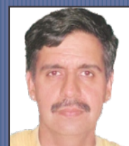
श्री संदीप दीक्षित ( सांसद )