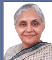
श्रीमती शीला दीक्षित ( मुख्यमंत्री )