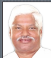
श्री महाबल मिश्रा (सांसद)