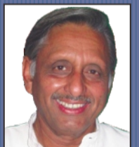
श्री मणिशंकर अयर ( पूर्व केन्द्रीय मंत्री )