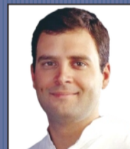
श्री राहुल गांधी ( मार्गदर्शक )