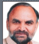
श्री गोविन्द प्रसाद मिश्रा (सांसद)