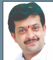
संत भय्यू महाराज