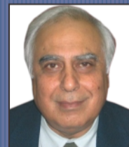
श्री कपिल सिब्बल ( केन्द्रीय मंत्री )