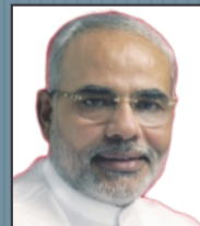
श्री नरेन्द्र मोदी