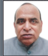
श्री डी.पी. त्रिपाठी (सांसद)