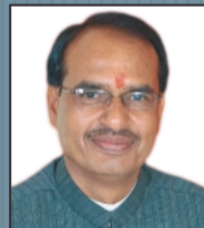
श्री शिवराज सिंह चौहान