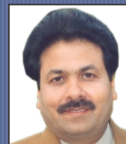
श्री राजीव शुक्ला ( केन्द्रीय मंत्री )