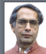
श्री विद्याचरण शुकला (पूर्व केन्द्रीय मंत्री)