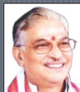
डॉ. मुरली मनोहर जोशी (पूर्व केन्द्रीय मंत्री)