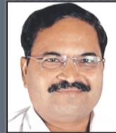
श्री बालकृष्ण शुकला (सांसद)