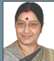
श्रीमती सुषमा स्वराज