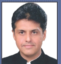
श्री मनीष तिवारी ( केन्द्रीय मंत्री )