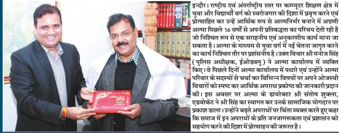
All India Cyber Securities Association (AICSA) would create awareness of Cyber Crimes

NEW DELHI: All India Cyber Securities Association (AICSA) is one of the leading organizations that work in of cyber crime those