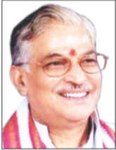
डॉ. मुरली मनोहर जोशी