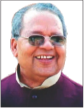
श्री कलराज मिश्र