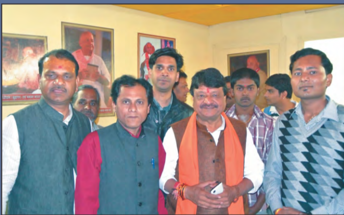
श्री कैलाश विजयवर्गीय ( मंत्री, म.प्र. शासन ) के साथ अंतर्राष्ट्रीय ब्राह्मण संसद के पदाधिकारीगण।