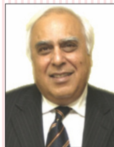
Shri Kapil Sibal Union Minister, HRD Govt. of India