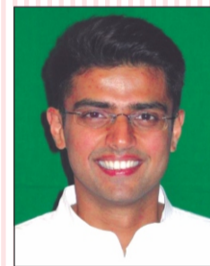
Shri Sachin Pilot MOS, Corporate Affairs Govt. of India