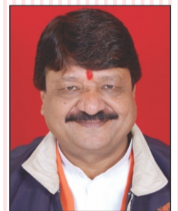
Shri Kailash Vijayvargiya Commerce & IT Minister Govt. of M.P.