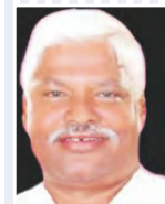
Sh. Mahabal Mishra Member of Parliament