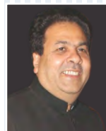
Sh. Rajeev Shukla Central Minister