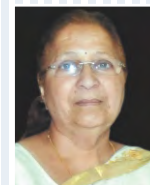
Smt. Sumitra Mahajan Member of Parliament