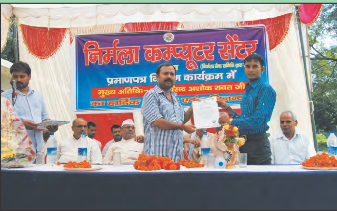
आयटा स्टडी सेन्टर हरदोई ( उत्तर प्रदेश ) के सांस्कृतिक कार्यक्रम में पुरस्कार वितरण करते हुए मुख्य अतिथि।