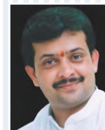
Sh. Bhaiyyu Maharaj Rashtra Sant