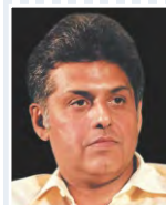
Sh. Manish Tiwari Central Minister