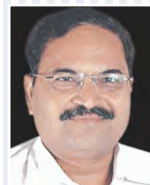
Sh. Balkrishna Shukla Member of Parliament