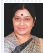
Smt. Sushma Swaraj Former Central Minister