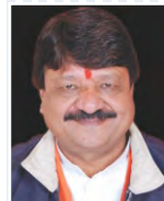
Sh. Kailash Vijayvargiya Minister, Govt. of M.P.