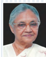
Smt. Sheila Dikshit CM, Delhi