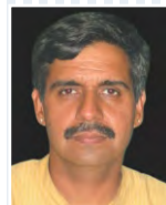
Sh. Sandeep Dikshit Member of Parliament