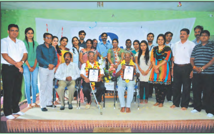
शिक्षक दिवस के अवसर पर अल्मा परिवार के सदस्य एवं पदाधिकारीगण।