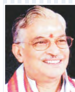
Dr. Murl Manohar Joshi Former HRD Minister