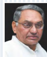
Sh. Janardan Dwivedi Member of Parliament