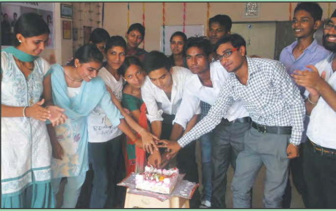
अल्मा कम्प्यूटर सेन्टर, करनाल ( हरियाणा ) में हुए सांस्कृतिक कार्यक्रम के दौरान विद्यार्थीगण एवं फैकल्टी।