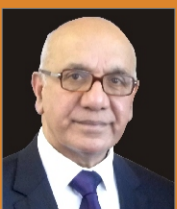
Virendra Sharma Member of British Parliament(UK) LONDON