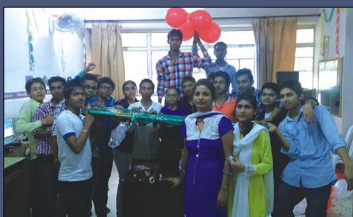
अल्मा कम्प्यूटर सेन्टर, करनाल ( हरियाणा ) में शिक्षक दिवस के अवसर पर स्टूडेंट्स एवं फैकल्टी स्टाफ।