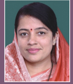
रिति पाठक सांसद, सीधी ( मध्य प्रदेश )

Email: info@aiita.org | Web: www.aiita.org