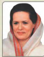
Smt. Sonia Gandhi

different strata for their care and concern. Alma has conceptualized Student Care Center (SCC) to update its students with latest information of Courses, International Certifications, Fee Structure, need of Identity Cards, Syllabus and so on. Apart from these, Student Care Center works to promote awareness activities among students along with welfare and motivate them with quiz and in-house competitions. Student Care Center runs by a committee of experts' panel that supports and provides guidelines for modus operandi of Enrollment, Registration, Roll Number, and Examination process. The committee also supports students in providing career counselling and placement suggestions to get proper employment. There is no doubt that choosing career option is tough for students and sometimes for their parents, so that cracking that dilemma, the counsellors of Student Care Center help those who need support.