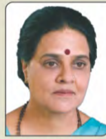
Dr. Girija Vyas