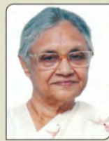
Smt. Sheila Dikshit