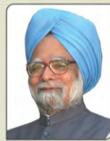
Dr. Manmohan Singh