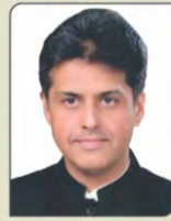
Sh. Manish Tiwari