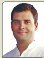
Sh. Rahul Gandhi